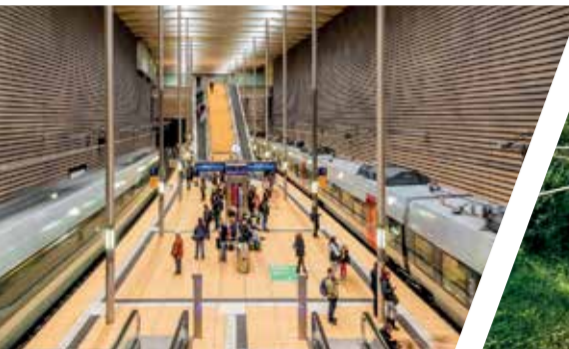
Citytunnel Leipzig Station Markt

Weitere Informationen erhalten Sie bei den Verkehrsunternehmen und -verbänden.