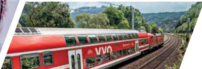
S-Bahn S 1 in der Sächsischen Schweiz