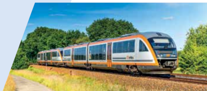
1 RE 2 in Arnsdorf auf dem Weg nach Liberec 2 trilex-Desiro unterwegs 3 RB 64 in Hoyerswerda