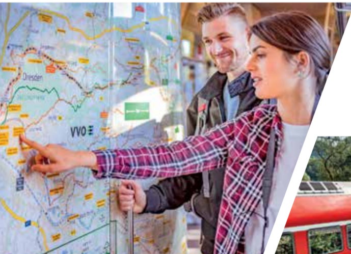
Unterwegs im ZVVO

Wir möchten Ihnen die Nutzung des öffentlichen Verkehrs so einfach wie möglich gestalten und verbessern die Anschlüsse zwischen Bus und Bahn, sorgen für ein einheitliches Tarifsystem, verständliche Informationen und kundenfreundlichen Service.