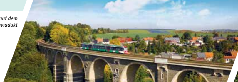
Citylink auf dem Bahrebachmühlenviadukt