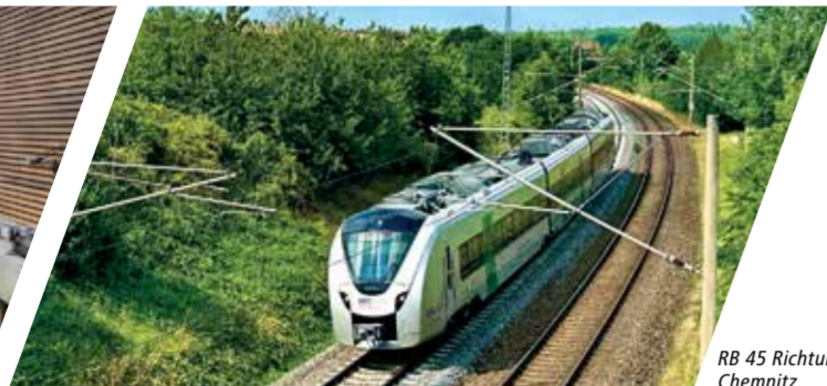
RB 45 Richtung Chemnitz